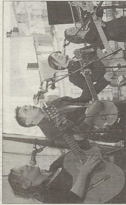
■ Un peu d'air avec la Roulette Rustre.

sons. Il faudra cependant attendre la toute fin du concert pour voir l'ambiance décoller vraiment. Sur leur magnifique chanson « La déclaration », les musiciens ont réussi à faire chanter le public. Un beau moment de fête et de communion partagée entre la foule et la scène, comme rarement sur le MET.