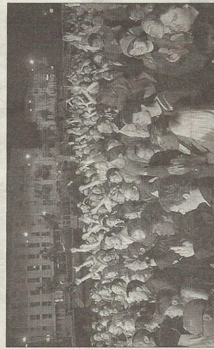
■ Un dernier morceau magique, partagé entre la foule et la scène.

sons de leurs six albums. Des moments poétiques et explosifs. La musique de DSLZ, qu'elle soit douce ou puissante, donne des fris-